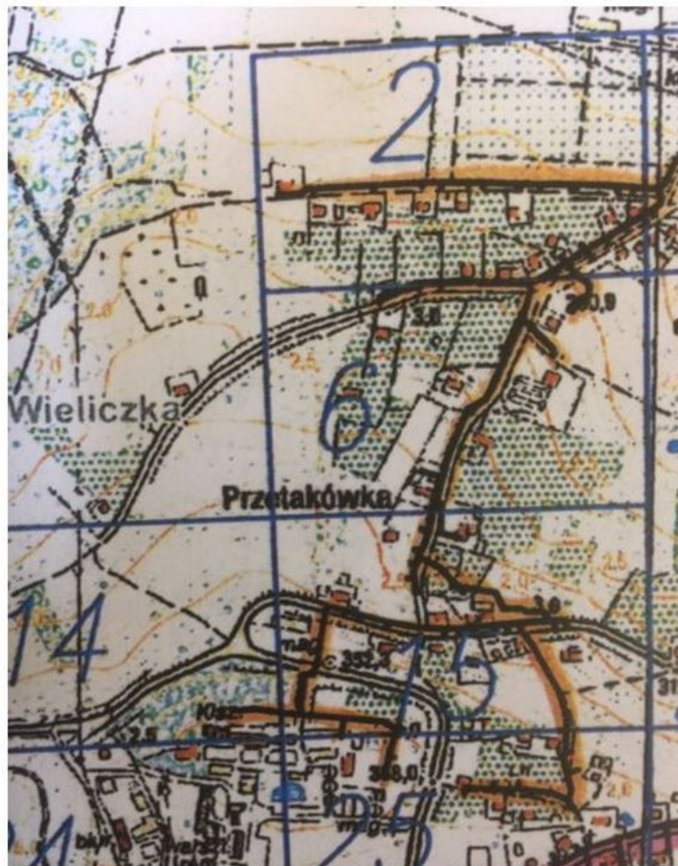
Mapa pogładowa terenu z możliwością przyłączenia do kanalizacji

W związku z odbiorem częściowym sieci kanalizacji sanitarnej w miejscowości Siercza zwracamy się z serdeczną prośbą o podłączanie nieruchomości do wykonanego uzbrojenia podziemnego. Możliwość taka istnieje w sposób grawitacyjny lub grawitacyjno - pompowy po wystąpieniu do ZGK w Wieliczce Sp. z o.o. Dział Techniczny ul. Słowackiego 10, Wieliczka tel.: 12 278 34 55, 12 291 48 52, 12 291 48 66 w celu uzyskania warunków technicznych przyłączenia do kanalizacji (wniosek dostępny jest w ZGK - ul. Słowackiego 10 oraz na stronie www.zgk.wieliczka.eu ).