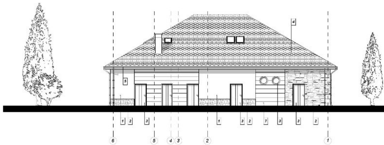
ELEWACJA PÓLNOOCNO - WSCHODNIA 1 : 100